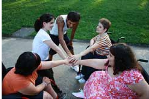
El dia Internacional de la Espina Bífida es va realitzar sota el lema Vine a compartir

Amputats Sant Jordi té un programa educatiu d'informació i sensibilització que realitzen en centres escolars.